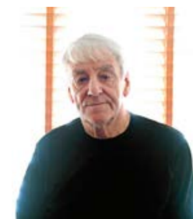
Regissören Colin Nutley åberopas som avskräckande exempel när det kommer till språket.

Kan det gå annat än illa i ett land där många har en så slapp och/eller aningslös hållning i språkfrågan? Nej, faktisk inte blir svaret! Det handlar för närvarande om ett språkligt och kulturellt självmord. Om det inte sker ett språkligt uppvaknande så är det kört.